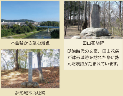
本曲輪から望む景色